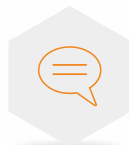
可定制的业务推送信息