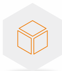
集成电商的交易、支付、物流功能